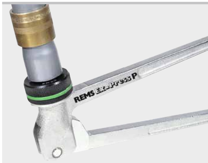
Kvalitní německý výrobek

Např. aquatherm, General Fittings, IVT, REHAU, REVEL, ROTEX, Seppelfricke, TECE, Würth