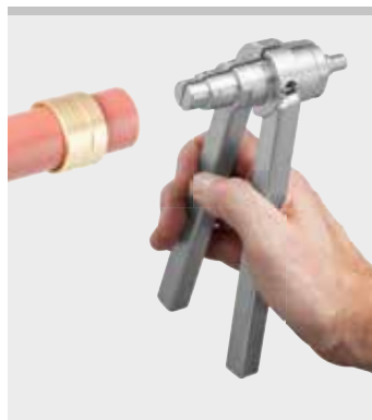
Kvalitní německý výrobek