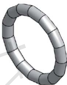
Těsnicí O-kroužek LBP