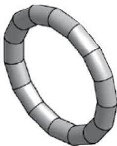
Těsnicí O-kroužek LBP