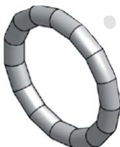
Těsnicí O-kroužek LBP