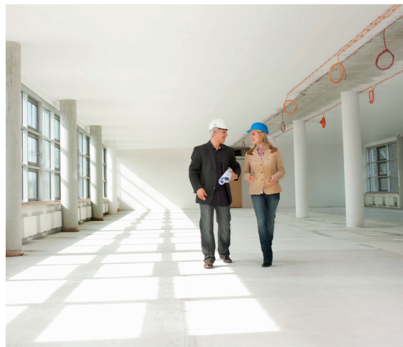
Během instalace není nutné připojení k internetu