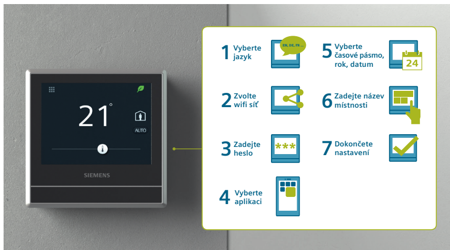
Průvodce pro snadné a rychlé uvedení do provozu